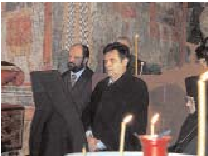
Божићној литургији у Пећкој Патријаршији, присуствовао је и премијер Коштуница

"Празник рођења Господа Исуса Христа је празник мира, празник радости, празник прашћања када нас богородица Христос окупила око своје Вишћлејемске ићине, око јаслицу у којима се родио. Од слављења Бога, од придавања себи вољи Божијој зависи и мир нас унутрашћи и мир сћољашћи. Онај