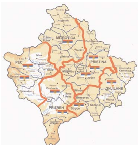
Мапа места које је посетио Председник Србије, Борис Тадић Map of places visited by President of Serbia, Boris Tadić