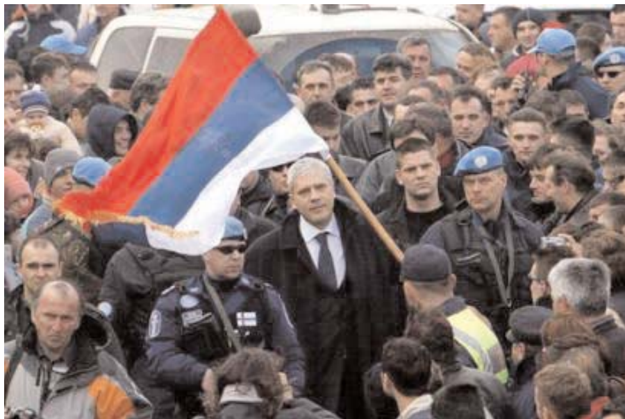
Председник Тадић у Штрпцу President Tadic in Strpce

He said that he asked for help because the independence of Kosovo is unacceptable, emphasizing that it would be a big mistake for international forces to leave the Province.