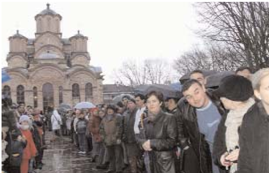
У очекивању доласка Председника In awaiting the arrival of President