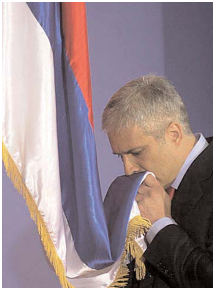
Председник Србије Борис Тадић са српском заставом President of Serbia Boris Tadić with Serbian flag

It is especially important that President Tadić confirmed the right of the Serbian community to use its legitimate symbols. If the Albanian community is free to use the flag of a neighboring foreign country (Albania) and its symbols (which it freely used even during the time of the Milosevic regime and the previous Tito's rule), it is completely normal that the Ser-