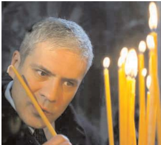
Председник Тадић пали свећу у манастиру Дечани President Tadic lights the candles in Decani monastery

Председник Тадић је узвративши поздраве епископу Теодосију и дечанским монасима рекао да доноси поруку мира, на првом месећу Србима,