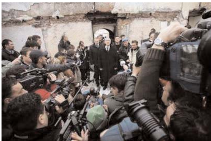
Конференција за штампу у Приштини у разрушеној цркви Св. Николе Press conference in Pristina, in destroyed church of St. Nikola

У саопштењу се подсећа да су косовске институције и УНМИК издвојиле значајна средства за обнову покрушених цркава и манастира, као и да тај посао може да почне, зависно од укључивања Српске православне цркве у тај процес.