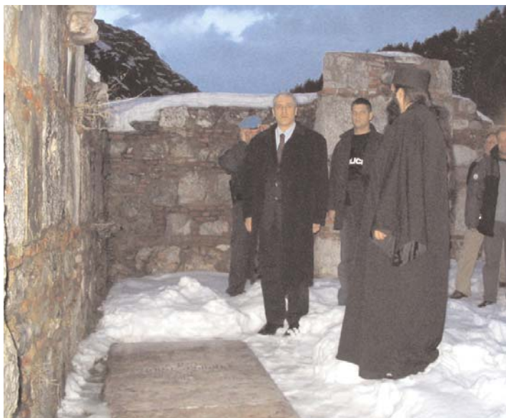
Председник Тадић на гробу Цара Душана у Светим Архангелима President Tadic at the tumb of Eperor Dusan in Sts. Archangels monastery

парирати физичком претњом, уценама, ђаљењем хришћанских цркава и ђљачком, као претходних година, већ једино ђолиитичким контира-аргументима и дијалогом. Водећи међународни фактори ђоследњих недеља често наглашавају да у процеси решавања стајшуса Косова и Метохије, када за што дође време, Београд и српски народ морају да имају своје легитимно место и да се не може прихватиити ниједно решење које би се намешнуло ђолиитичком диктајта и силе.