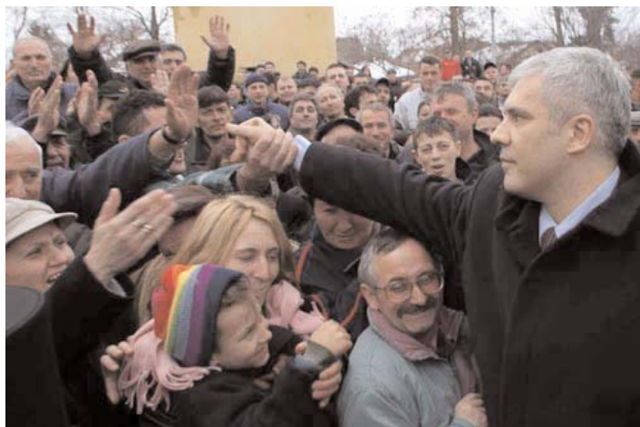
Посета Липљану Visit to Lipljan

'Kosovo Serbs are today people in the most difficult position in Europe', Tadic said.