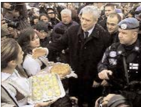
Дочек Председника Welcome Greetings to President