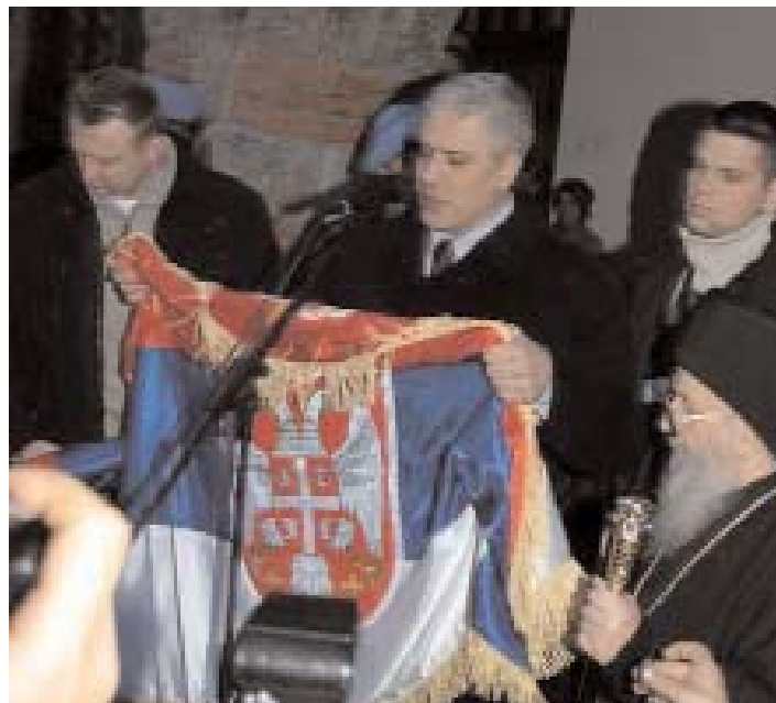
Председник Тадић предаје српску заставу владци Артемије President Tadic gives Serbian flag to Bishop Artemije

Tadic's message to the Albanian people was that if they have the right to fly flags on their houses, no one can take away the right of Serbs to fly their flag on their houses, schools or institutions.