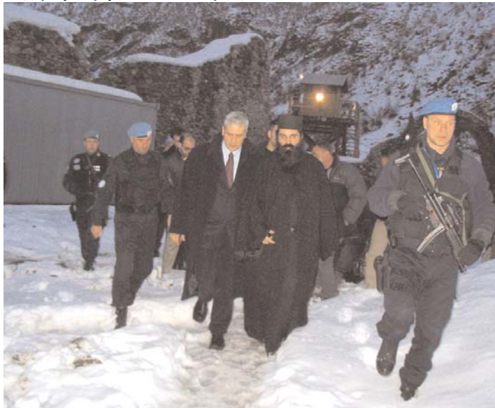
Долазак у манастир Светих Архангела, крај Призрена Arrival in visit to Sts. Archangels monastery near Prizren

Епархија рашко-призренска изражава искрено жаљење због нервозне реакције албанске јавности која је и овај пут преко медија показала своју незрелост и несиремност да демократски шолерише мишљење других. Претње насиљем преко шtamпе и директно нападима на председничку колону камењем и леденицама показале су да на Косову и Метохији нема одговарајуће безбедности и да се за сада тешко може говорити о остварењу стандарда. Крајње је време да албански прваци који подстичу медијску хајку на све што је српско схвасе што не може више