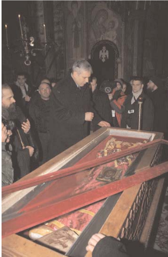
Председник Тадић целива мошти Светога Краља Стефана Дечанског President Tadic kisses the holy relics of St. King Stefan of Decani

Након посеће манастиру Св. Архангели председник Тадић је поружио до Велике Хоче.