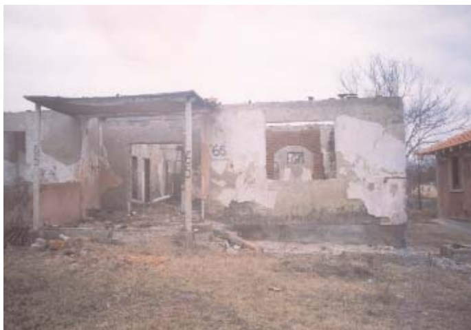
Призори из села Видање, јануар 2005.

ЕРП КИМ Инфо-служба на основу извештаја агенција ТАНЈУГ и БЕТА