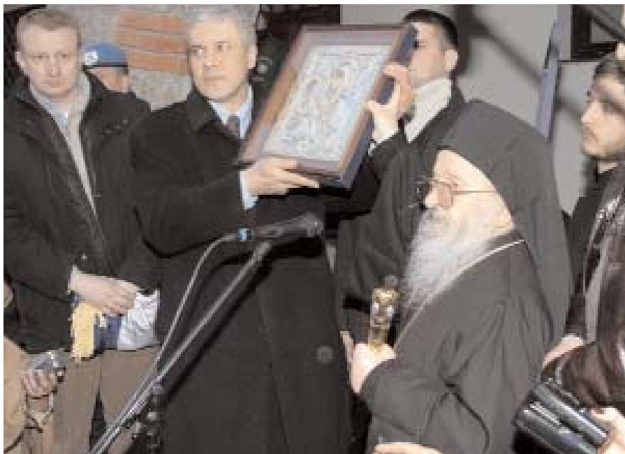
Председник Тадић прима икону Пресвете Богородице Тројеручице од Владике Артемија The Icon of Holy Mother of God presented to President Tadic by Bishop Artemije

In Gracanica this evening Tadic also spoke with representatives of Serbs from central Kosovo.