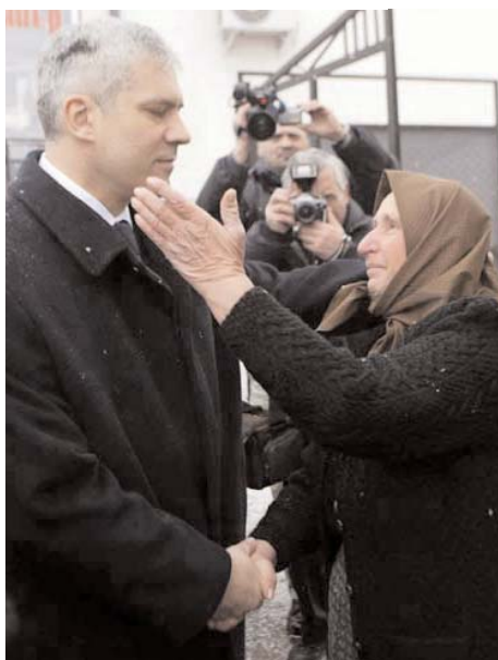
Председник Тадић у Церници President Tadic in Cernica