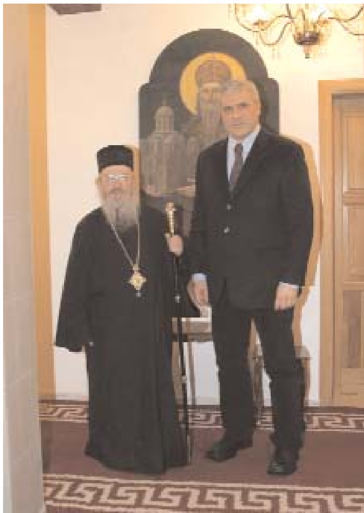
Председник Тадић и Владика Артемије у Грачаници President Tadic and Bishop Artemije in Gracanica

равамо право на њихове легитимне интересе", рекао је Тадић. Он је истакао да се Срби овђе суочавају са бројним проблемима, јер нема сигурје, воде и слободе. "Нема народа у Европи који живи у штежним условима од српског народа на Космету. Требају нам савезници, јер сами не можемо решити проблеме и зашто инсистирам на политици савезништва", рекао је Тадић.