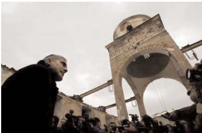
Пред разрушеном црквом Св. Николе у Пристини In front of destroyed St. Nikolas church in Pristina

With his visit to Kosovska Mitrovica, president Tadic completes his two day stay in Kosovo and Metohija.